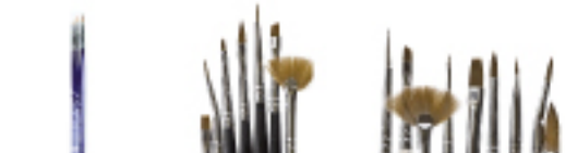
Set 3 pinceles Set 7 pinceles Set 10 pinceles